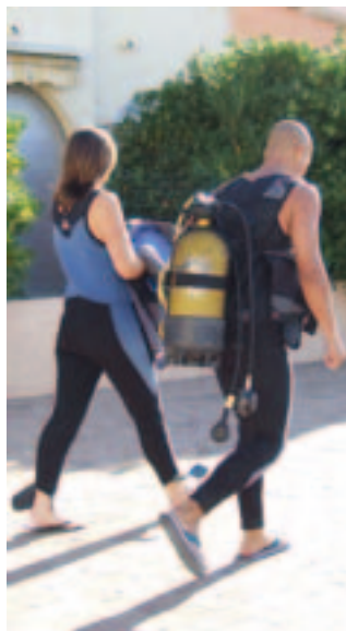
Avant de flotter en apesanteur, il faut porter la quinzaine de kilos d'équipement !

9h30 tout le monde a rejoint le bateau, à quelques dizaines de mètres à peine du local. Une distance suffisante pour se rendre compte que l'élément de prédilection du plongeur est bel et bien l'eau, car avant de flotter en apesanteur, il faut porter la quinzaine de kilos d'équipement ! Une fois à bord, le bateau et sa vingtaine de plongeurs quitte le port, et prend le large.