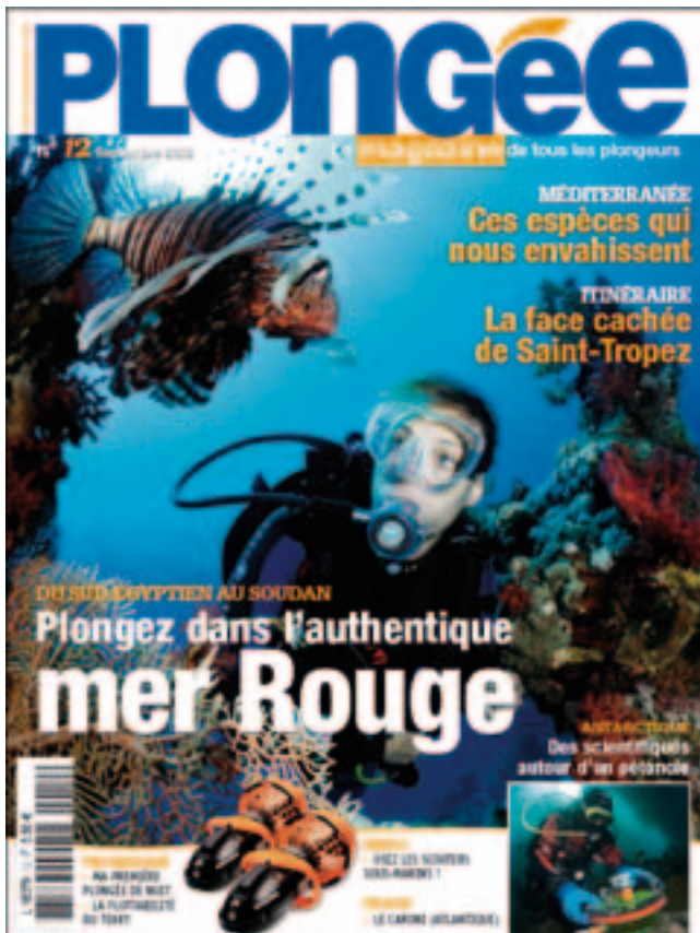
Couverture du "Plongée magazine" n°12 illustrée par une photographie de Fred Maxant